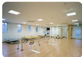
リハビリテーション室(200㎡)