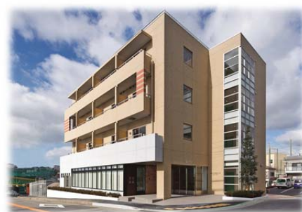
本社ビル兼高齢者住宅「大脇ハウス」